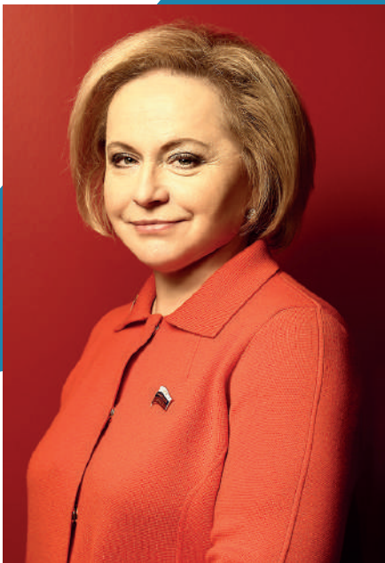
Любовь Николаевна Духанина, заместитель председателя Комитета по образованию и науке ГД РФ, член Центрального штаба ОНФ, координатор проекта «Равные возможности – детям»